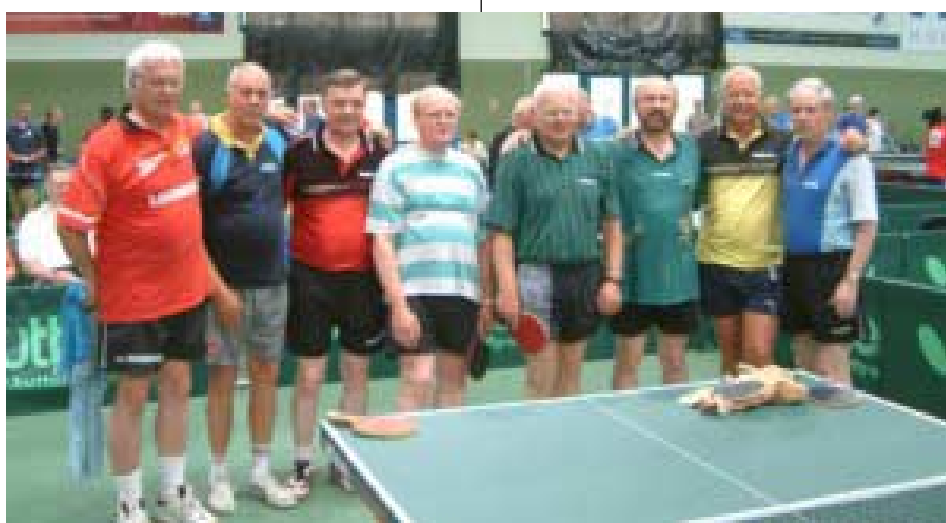
Foton från Bratislava tagna av Dipl.-Ing. Michael Pollak från Tyskland. "Lånade" från hans hemsida http://www.returnboard.de/ .