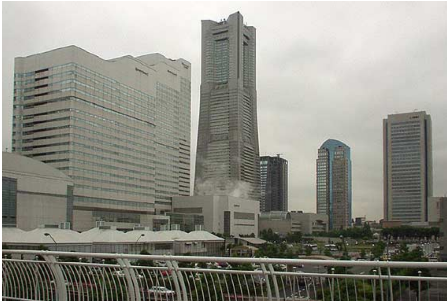
Imponerande byggnadsverk i Yokohama, Queens Tower, 70 våningar höga Landmark Tower, Mitsubishi building mfl.