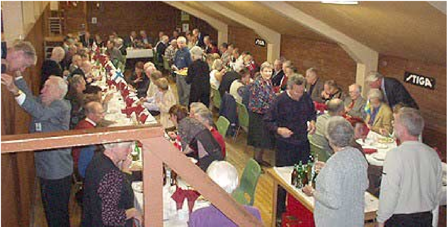
Det alldeles fullsatta facket vid banketten.