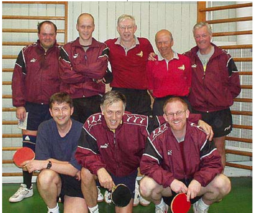
Alla deltagarna vid KM samlade till gruppfoto.