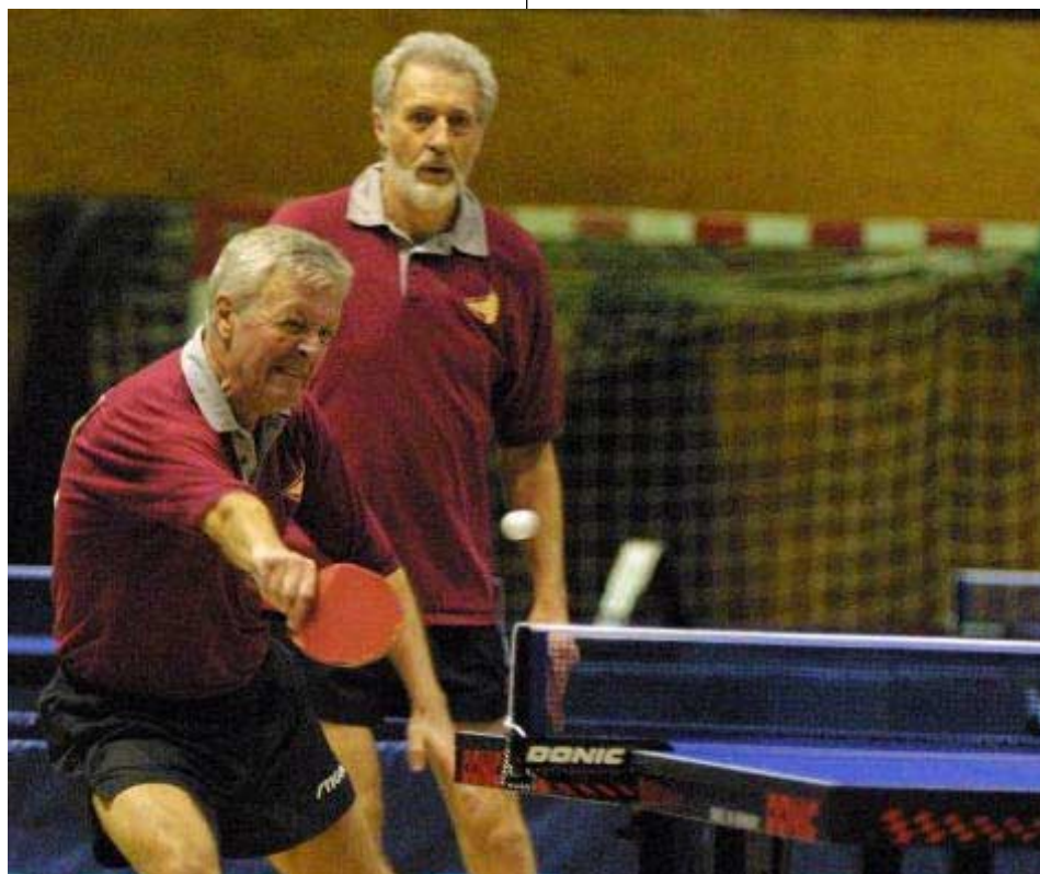
Hasse och Bosse i action på Veteran-SM.