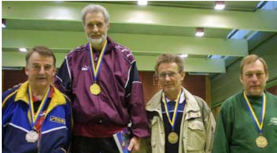
Prispallen från VSM.

äger rum onsdag 7 maj som framgår av inbjudan på annan plats. Alla medlemmar bör då