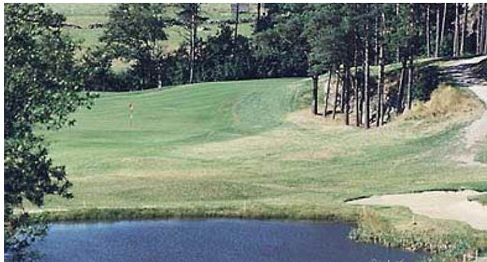
Bild över hål nr 10.