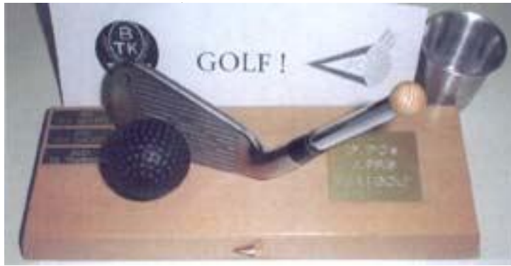
Bilden visar Ifo's vandringspris. Initiativtagare till detta pris är Ifo's altmeister Ive Hjort som skapat detta pris med hjälp av bl. a ett klubbhuvud från Lasse Hanssons järntrea.