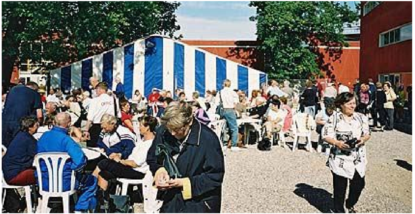
Exteriör från stora spelhallen, med det välbesökta öltältet.